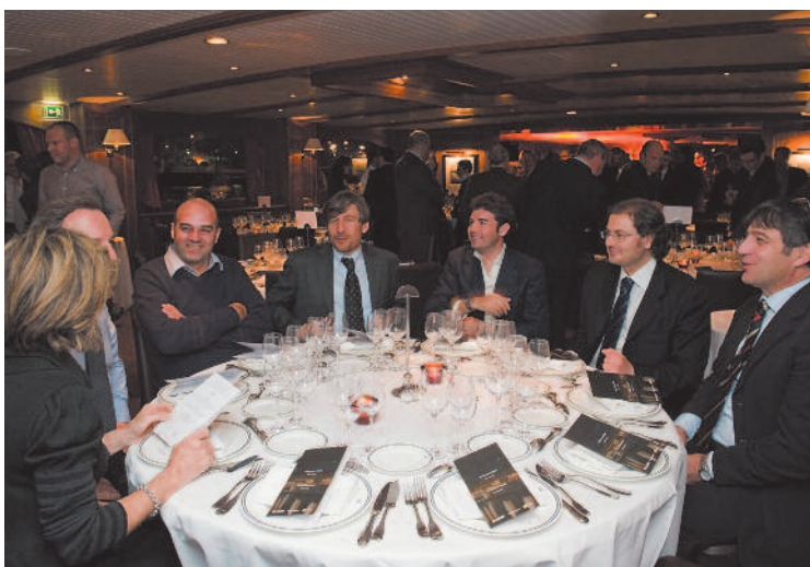
Un tavolo di ospiti durante l'evento sulla Senna