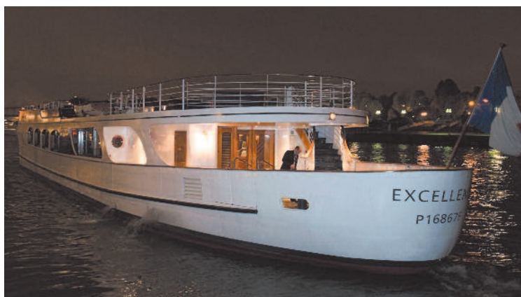
Lo yacht Excellence per l'esclusiva cena-crociera JAL Group