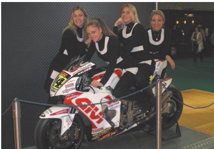
Il corner sponsorship Aimont con alcune hostess JAL group