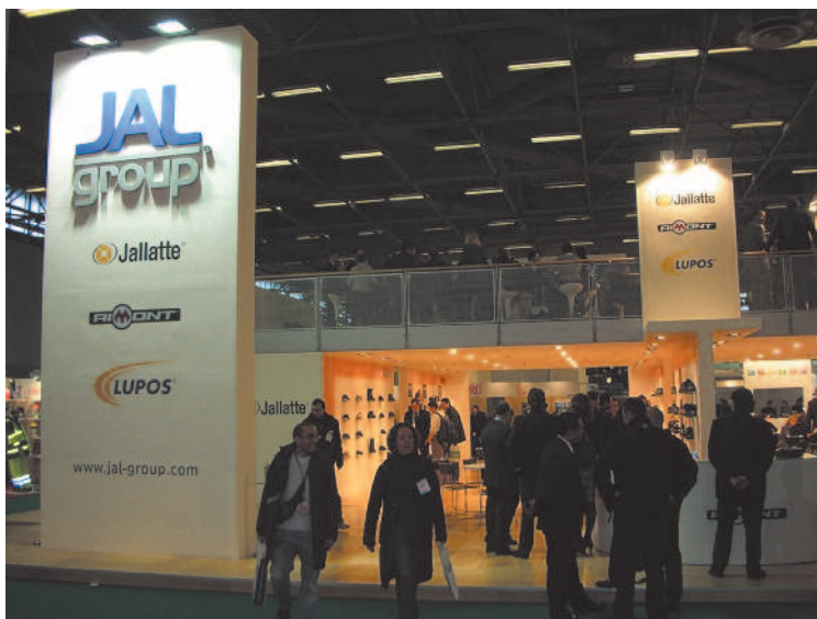
Lo stand JAL Group a Expoprotection Parigi '08

"L'ottima affluenza di presenze e i numerosi nuovi contatti hanno confermato la rilevanza in-