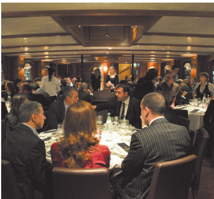
Atmosfera elegante raffinata per i clienti Jallatte e Aimont

In un'atmosfera elegante ed esclusiva, si è svolto nella serata di giovedì 6 novembre l'evento che JAL Group® ha organizzato per i migliori clienti europei dei brand Jallatte® e Aimont®: navigando sulla Senna a bordo del lussuoso yacht Excellence, gli oltre cento ospiti hanno apprezzato la raffinatezza della cena e la qualità dell'accompagnamento musicale, respirando la magia della notte parigina in una crociera unica ed indimenticabile.